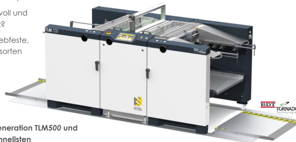
TLM 700 palette

Mit der neuen Maschinengeneration TLM500 und TLM700 sind Sie fit für die schnellsten Kundenaufträge!