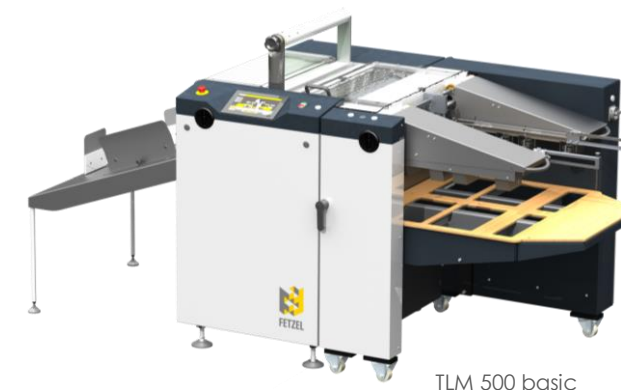
TLM 500 basic