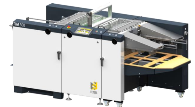
TLM 500 pro