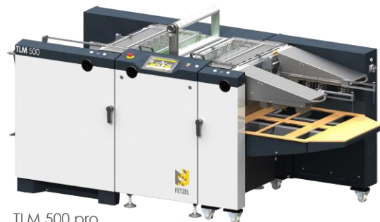
TLM 500 pro