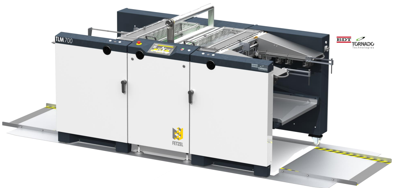
TLM 700 palette

Mit der neuen Maschinengeneration TLM500 und TLM700 sind Sie fit für die schnellsten Kundenaufträge!