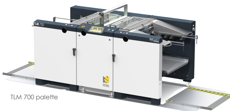
TLM 700 palette