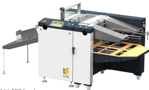
TLM 500 basic